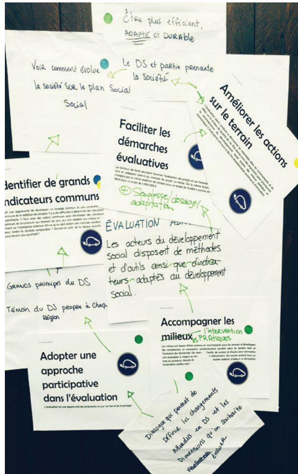
SCHÉMA DES ÉTAPES POUR L'ÉVALUATION